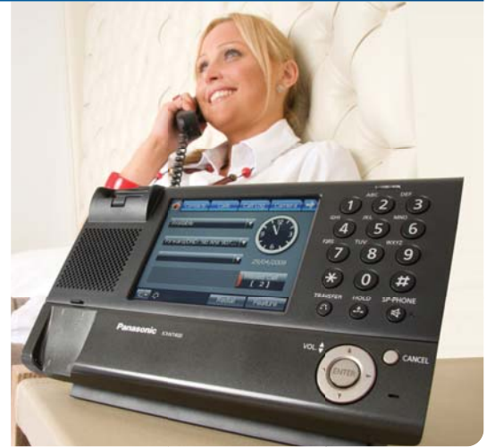
BROCHURE TELEFONO IP KX-NT400